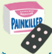
市販の鎮痛薬を試す